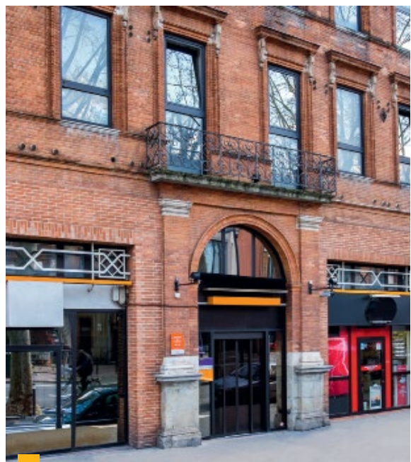
8, boulevard de Strasbourg à Toulouse (31)