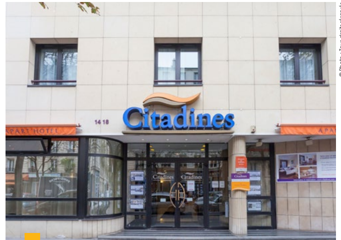
14-18, rue de Chaligny à Paris 12 ème

* Montant total des loyers facturés rapporté au montant total des loyers facturables, c'est-à-dire loyers quittancés + loyers potentiels des locaux vacants.